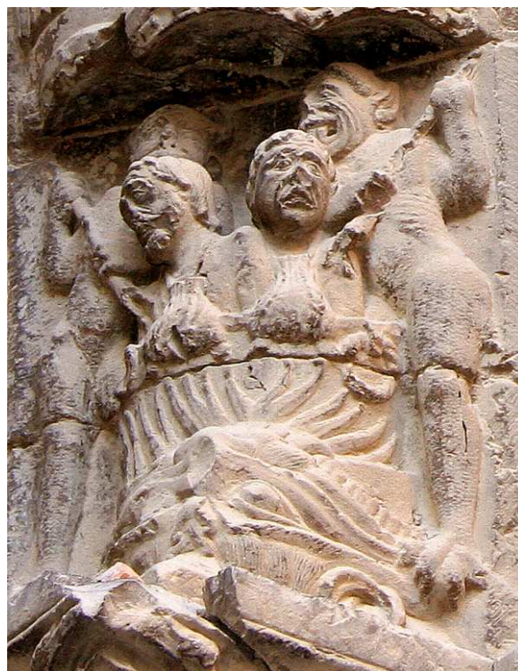
Catedral de Tudela, Navarra (España), Puerta del Juicio (primeras décadas del siglo XIII). Castigo del avaro arrojado al río con la bolsa al cuello para que se ahogue y pareja de avaros en la caldera hirviendo.

http://www.unav.es/catedrapatrimonio/paginasinternas/visitasweb/visita01/detalle-08bisb.html ; http://www.unav.es/catedrapatrimonio/paginasinternas/visitasweb/visita01/detalle-08bisa.html [capturas 20/11/2010]