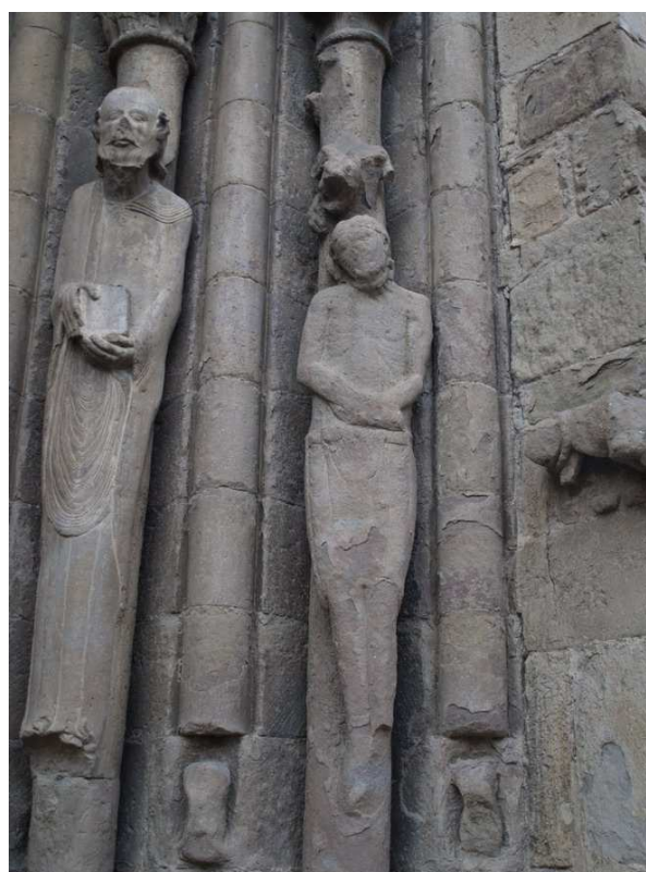
Santa María la Real de Sangüesa, Navarra (España), portada meridional (segunda mitad del siglo XII). Estatuas columna de la jamba derecha. A la derecha, ahorcado, JVDAS MERCATOR.