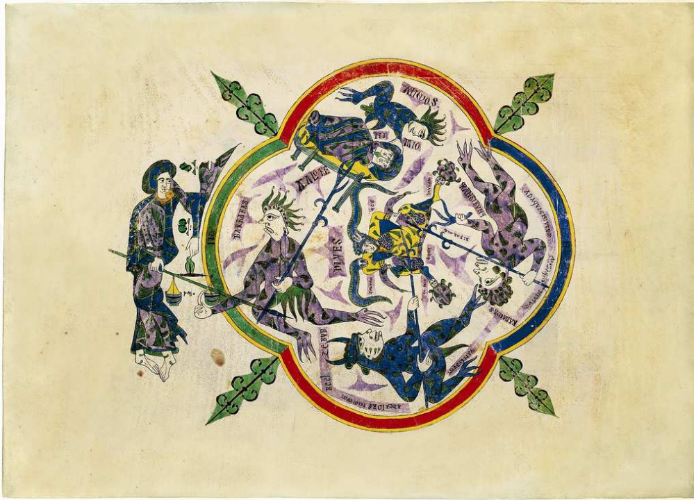
Beato de Santo Domingo de Silos (ca. 1100). Londres, British Library, Ms. Add. 11695. Página del Infierno con la figura central de DIVES .

http://www.flickr.com/photos/52462947@N03/4835329940/ [captura 20/11/2010]