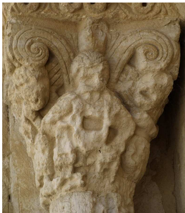
San Martín de Frómista, Palencia (España), portada septentrional (ca. 1100). Avaricia.

http://www.arquivoltas.com/8-palencia/Trapa%20G13.jpg [captura 20/11/2010]