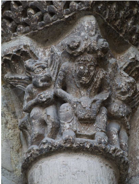
Saint-Sernin de Toulouse (Francia), Porte des Comtes (ca. 1080). Avaricia .