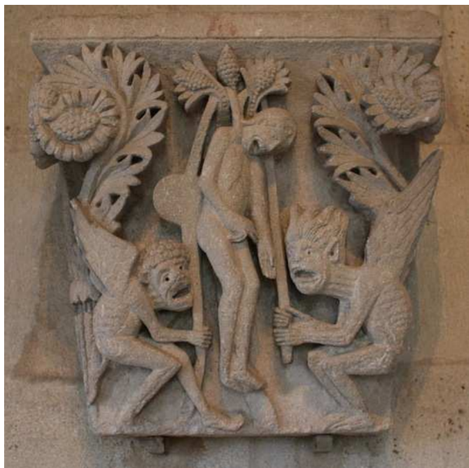
San Lázaro de Autun (Francia), capitel (comienzos del siglo XII). Ahorcamiento de Judas .