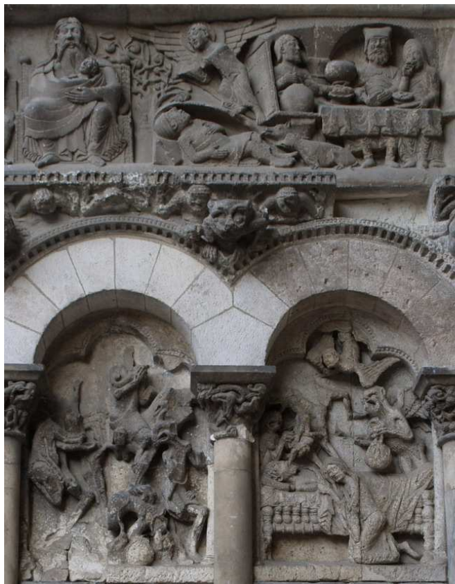
Abadía de Moissac (Francia), pórtico (comienzos del siglo XII). Avaricia (izquierda) y Lázaro y Epulón con el castigo destinado a la muerte de este último (derecha).