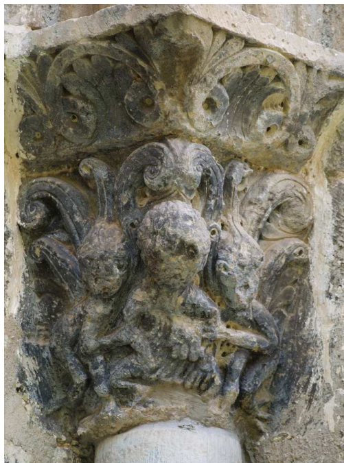
Santa María de Iguácel, Huesca (España), portada occidental (fines del siglo XI). Avaro entre dos demonios .

http://images.cdn.fotopedia.com/flickr-2562064019-image.jpg [captura 20/11/2010]