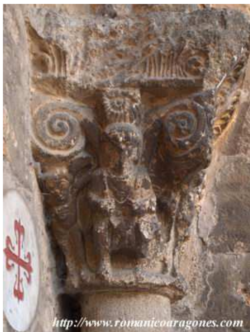
Abadía de San Isidro de Dueñas, Palencia (España), portada occidental (ca. 1100). Avaricia.

http://www.arquivoltas.com/8-palencia/Trapa%20G13.jpg [captura 20/11/2010]