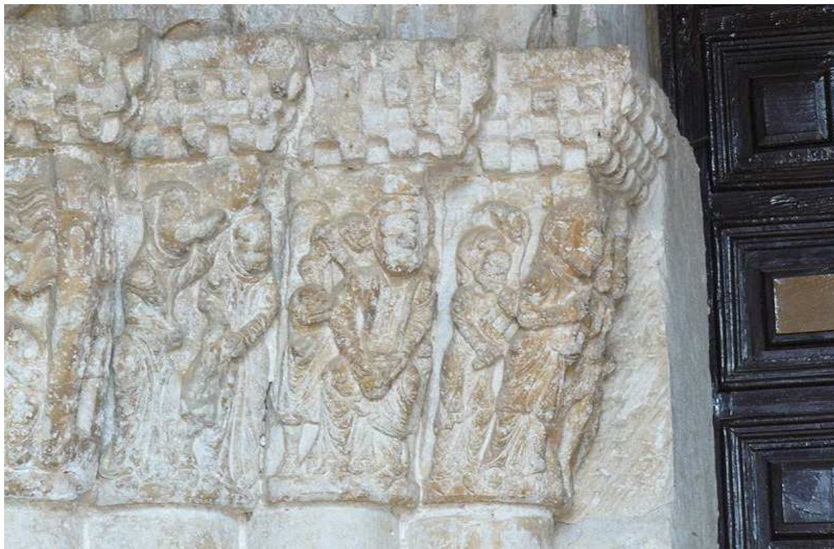
Parroquial de San Miguel Arcángel en Languilla, Segovia (España), portada (finales del siglo XII). Herodes (con bolsa al cuello) aconsejado por el diablo que ordene la matanza de los inocentes.

http://commons.wikimedia.org/wiki/File:Languilla21.JPG [captura 20/11/2010]