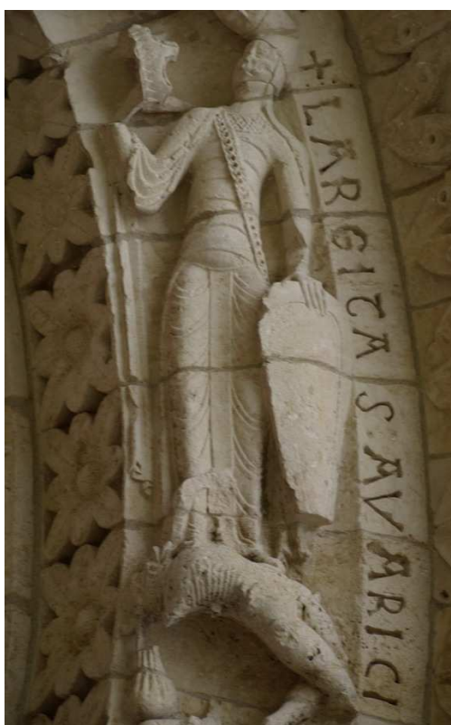
Saint-Pierre de Aulnay (Francia), portada occidental (primera mitad del siglo XII). La Generosidad derrotando a la Avaricia.